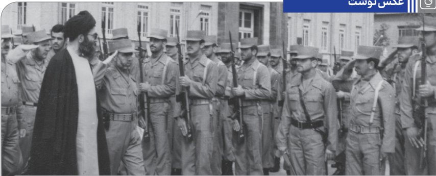
تصویری از حضور آیت الله خامنه‌ای در مراسم دانش آموزی دانشجویان افسری ارتش جمهوری اسلامی ایران