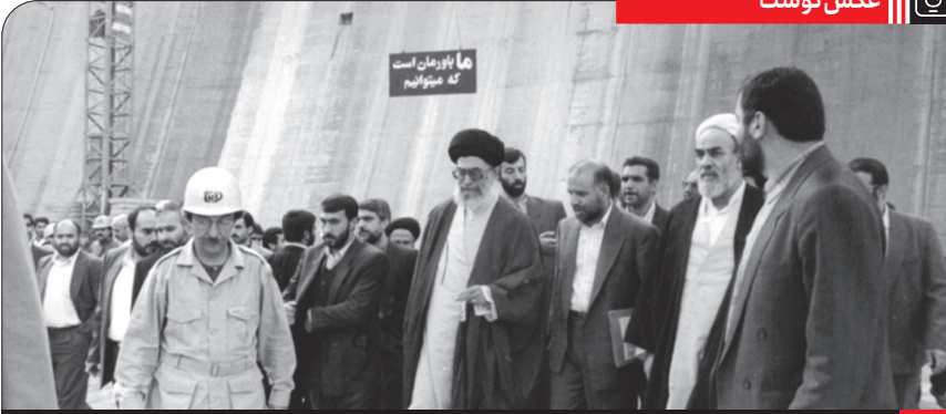
بازدید رهبر انقلاب از روند ساخت سد کرخه، ۱۳۷۵/۱۲/۲۴