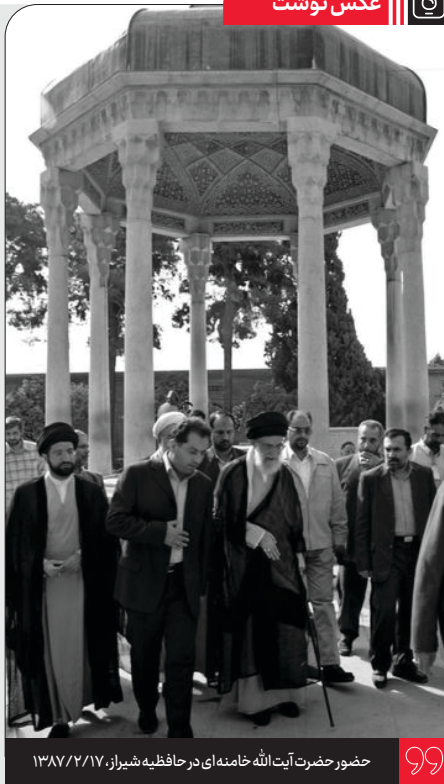
حضور حضرت آیت الله خامنه‌ای در حافظیه شیراز، ۱۳۸۷/۲/۱۷